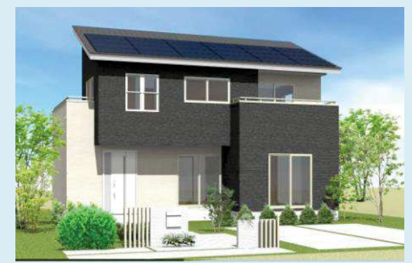
※画像は積雪100cm未満の外観です。

収納スペースが充実したプラン。家族共用の収納には毎年増えていくアルバムなど思い出の品をしまえます。見せたくない掃除用具も収納できて便利です。